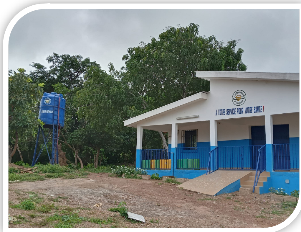
Centre Médical SAREPTA de Tangfla doté d'un château d'eau