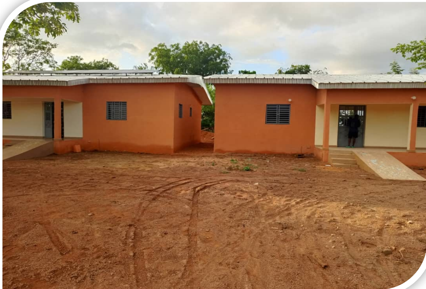
Centre Médical SAREPTA de Tangafila , 1 er et 2 e logements du Personnel Soignant, réalisés en 2023 et 2024

Engagez-vous à nos côtés pour poursuivre l'aventure au service des populations rurales de Côte d'Ivoire, en Afrique de l'Ouest !