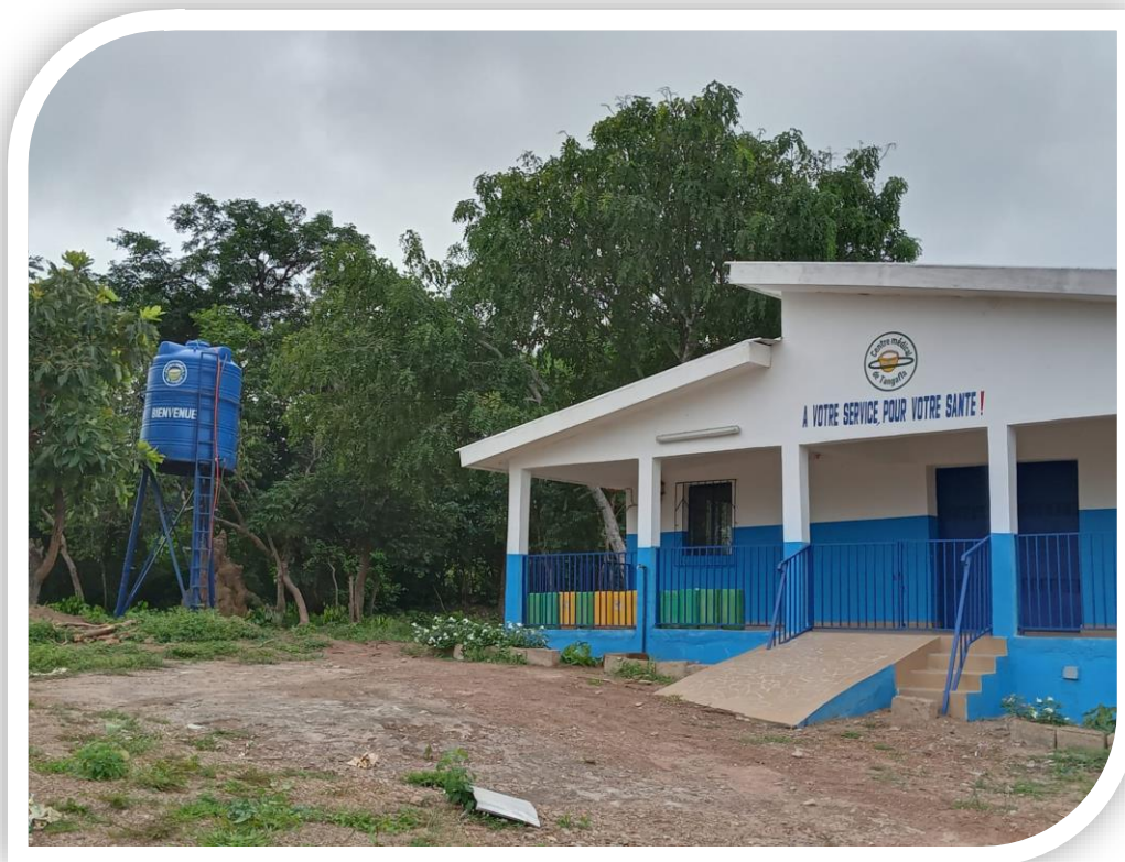
Centre Médical SAREPTA de Tangafla doté d'un château d'eau