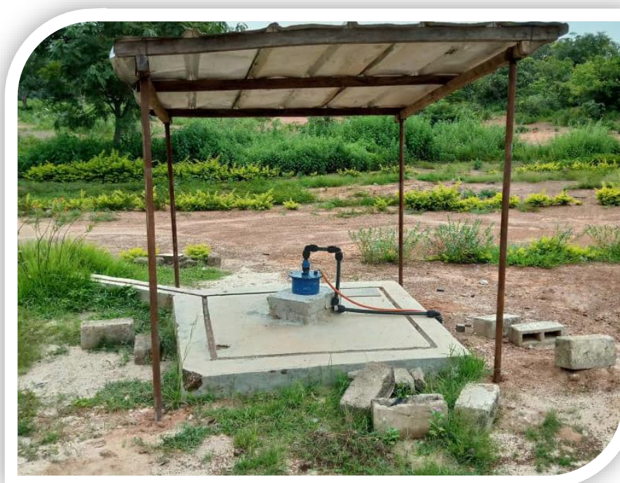
Centre Médical SAREPTA de Tangafla doté d'une Pompe Automatique pour remplir le château d'eau