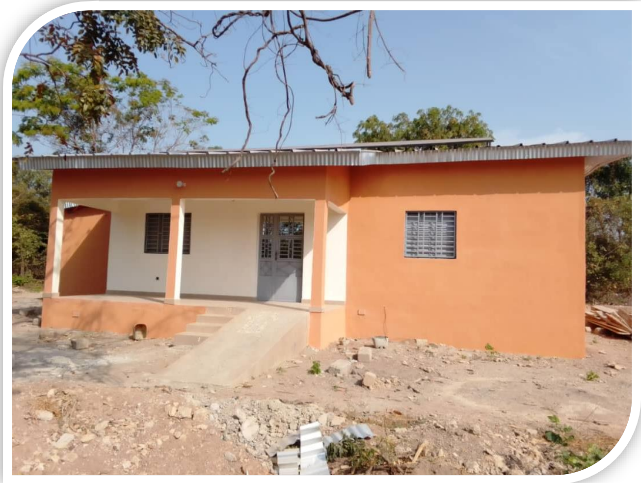
Centre Médical SAREPTA de Tangafila , 1er logement du Personnel Soignant

Engagez-vous à nos côtés pour continuer l'aventure au service des populations rurales de Côte d'Ivoire en Afrique de l'Ouest !